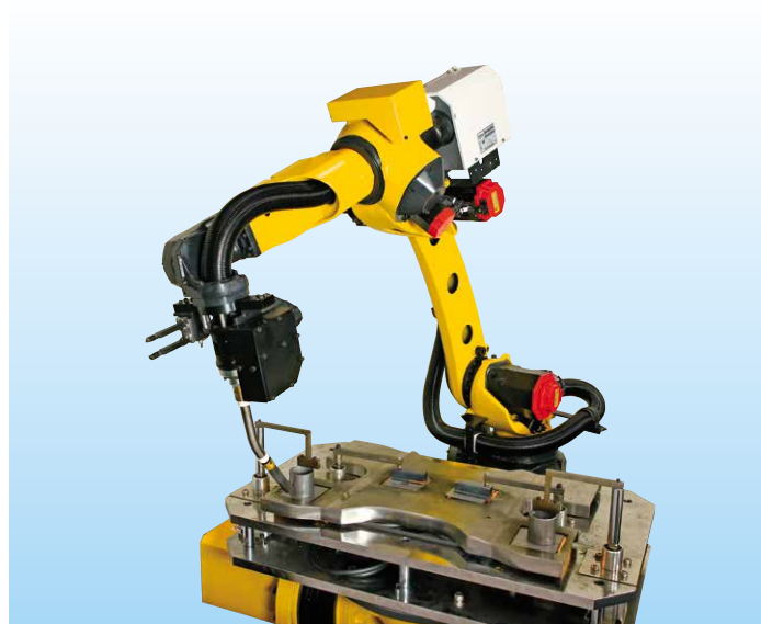
与变位机协调动作，进行薄板低碳钢焊接