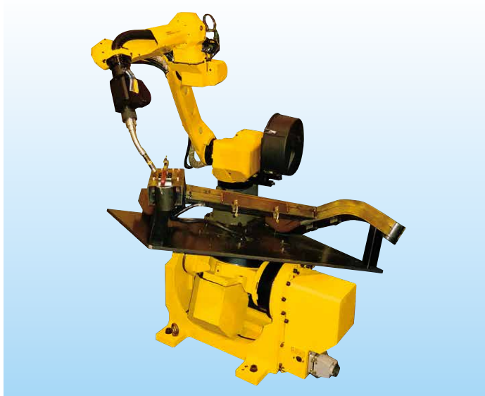
サーボトーチによる自動車部品のアーク溶接