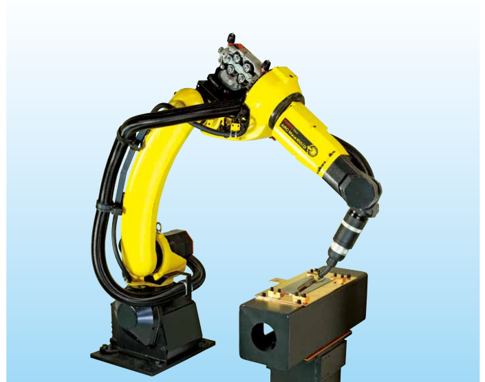
ステンレス部品溶接