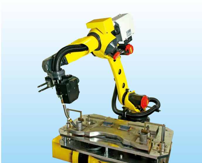
ポジショナとの協調薄板軟鋼溶接