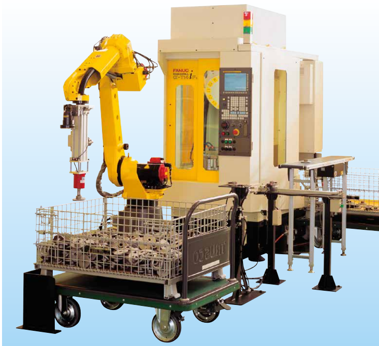
小物部品のバラ積み取り出し