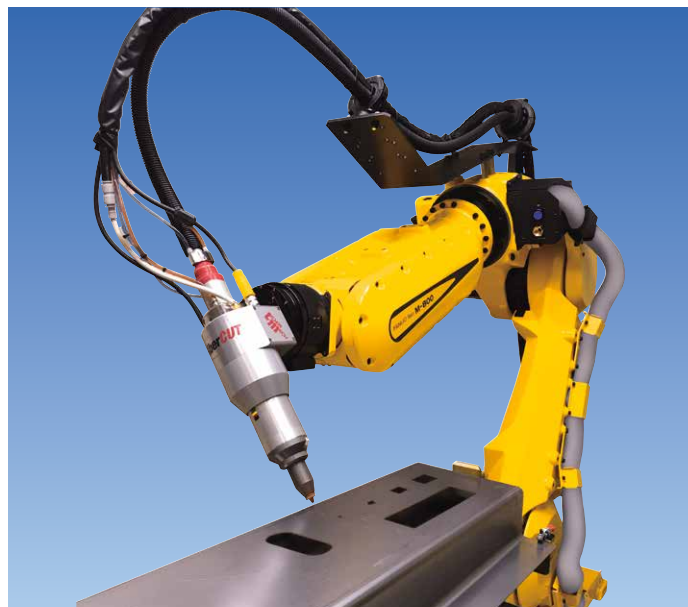
高精度レーザ切断