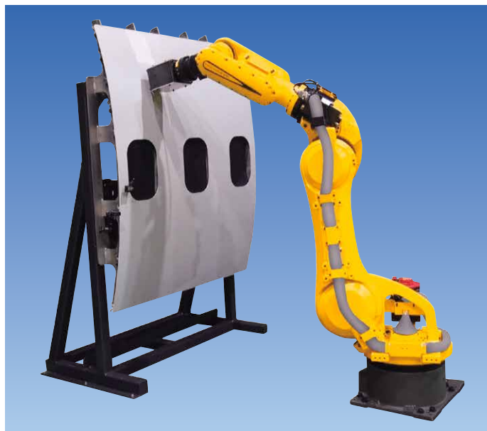
高精度穴あけシステム