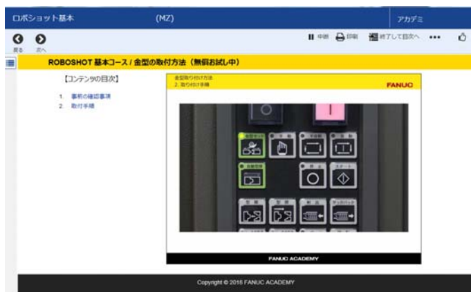
動画コンテンツ例